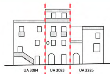
Via della Faina