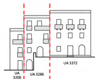
Largo del Plebiscito